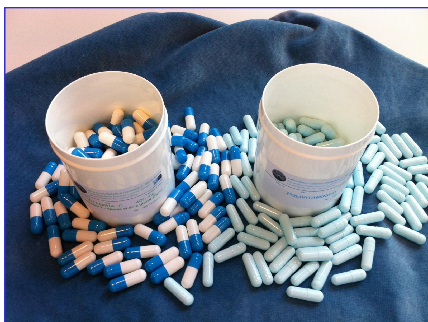
Fig.1 Capsule di polivitaminico e vitamina E